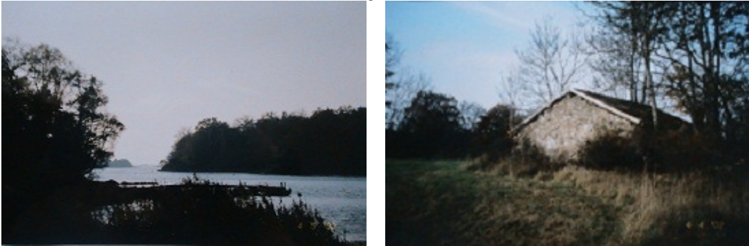
Biskopsmåla. Foto Sabina Santesson 2004.